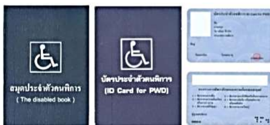
ตัวอย่างบัตรและสมุดประจำตัวคนพิการ

*** กรณีได้รับเบี้ยยังชีพคนพิการอยู่แล้วและได้ย้ายเข้ามาในพื้นที่ตำบลระแว้ง จะต้องมาขึ้นทะเบียน และยื่นคำขอรับเงินเบี้ยความพิการที่ อบต. ระแว้ง และให้ได้รับเบี้ยความพิการจากองค์กรปกครองส่วน ท้องถิ่นในเดือนถัดไป ทั้งนี้ต้องได้รับการยืนยันจากองค์กรปกครองส่วนท้องถิ่นเดิมที่จ่ายเงินเบี้ยความ พิการเพื่อไม่ให้เกิดความซ้ำซ้อน