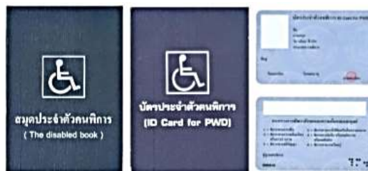
ตัวอย่างบัตรและสมุดประจำตัวคนพิการ

*** กรณีได้รับเบี้ยยังชีพคนพิการอยู่แล้วและได้ย้ายเข้ามาในพื้นที่ตำบลระแว้ง จะต้องมาขึ้นทะเบียน และยื่นคำขอรับเงินเบี้ยความพิการที่ อบต.ระแว้ง และให้ได้รับเบี้ยความพิการจากองค์กรปกครองส่วน ท้องถิ่นในเดือนถัดไป ทั้งนี้ต้องได้รับการยืนยันจากองค์กรปกครองส่วนท้องถิ่นเดิมที่จ่ายเงินเบี้ยความ พิการเพื่อไม่ให้เกิดความซ้ำซ้อน